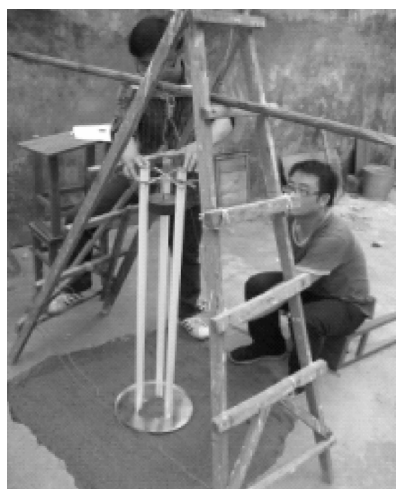
图2 强夯模型试验支架