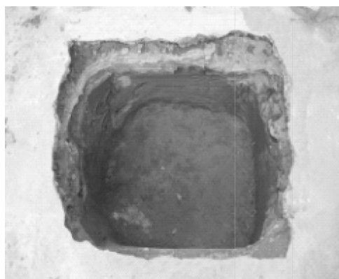
图1 强夯模型试验坑