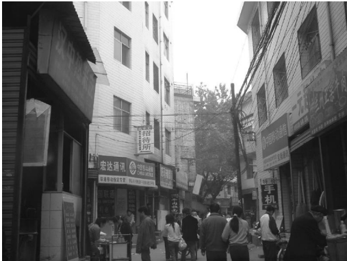
图 1 改造前的某城中村街道现状 Fig. 1 Status quo of an urban village prior to reconstruction

次,城市化初期国家征用了农民作为生产资料的农业用地,但保留了农民作为生活资料的宅基地和集体房产用地,间接促成了城中村的租屋经济,因其租金低廉,地理区位便捷,吸引了大量外来务工人员租住,并成为在城中村居住的主要群体;第三,城中村在不断接受城市文化的同时,仍然延续传承着农村的传统文化,而混居在这里不同地区的外来务工人口,也将其所在地方的特色文化引入城中村,使城中村呈现出多元城乡文化的特征(图 1,图 2)。