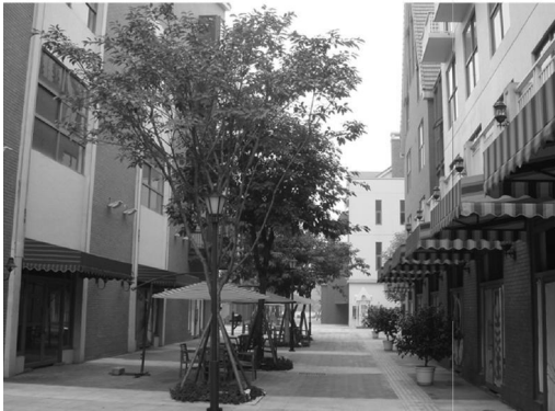
图 2 改造后的某城中村文化商业步行街 Fig. 2 Cultural & commercial pedestrian mall in an urban village after reconstruction

借鉴西方城市更新的经验和失误,站在城市立场考虑的问题显然是自相矛盾的,这种思考方式受到城市偏好的影响,只能反映出城中村问题的表象,即与城市概念标准相悖离的部分,这包括: