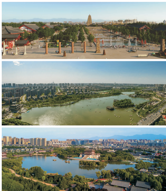
图5 大雁塔北广场、曲江池遗址公园与大唐芙蓉园

注重与大雁塔的相互关照，构建出因借曲江山水、演绎盛唐苑囿的大型城市园林；唐城墙遗址公园(曲江段)以唐长安城外郭城遗址为界限，借绿化与景观设计展现城墙内外的不同景象；曲江池遗址公园结合曲江池水岸遗址的考古勘察与历史文献考证，建成独具生态山林野趣与历史文化内涵的城市文化遗址公园(图5)。再如大唐不夜城，以盛唐文化为主题兴建形成了集音乐厅、影院、美术馆、剧场四大文化设施和四大文化广场于一体的大型城市公共文化空间，以文化产业振兴带动大雁塔风景区的经济和文化发展，成为首批全国示范步行街。