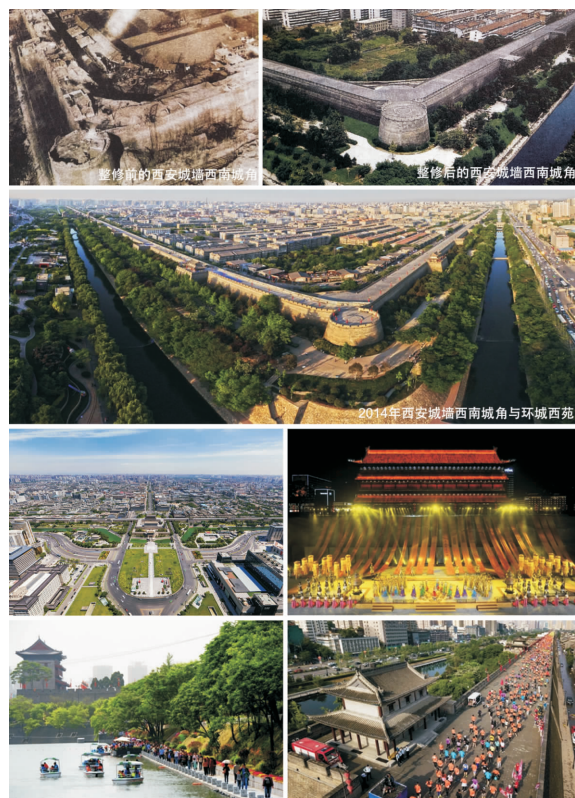
图2 西安城墙、南门区域整修后现状

通过整合提升南门广场的建筑、绿化与景观系统，强化了西安城市南北中轴线的空间秩序和历史感。正是通过持续多元化的高品质城市公共空间提升改造举措，促进了城、墙、河、路、景的进一步融合发展，使城墙成为西安旅游观光的枢纽、重大节庆活动和民间艺术的空间载体(图2)，如结合月城博物馆、箭楼博物馆、城墙入城迎宾文化演出、西安城墙国际马拉松、城墙灯会、瓮城音乐会等文化专题场馆与文化演出项目进行多项社会活动，西安城墙成为最重要的市民活动公共空间载体之一。