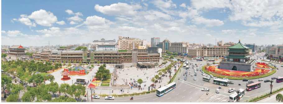
图 3 西安钟鼓楼广场